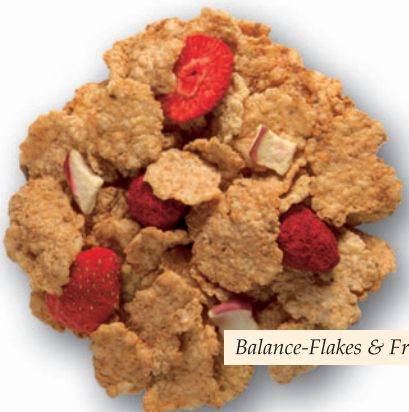
Balance-Flakes & Fruits

>> Moderne Menschen sind wählerisch , wenn es um die Auswahl des Frühstücks geht. Denn diese Mahlzeit ist für sie besonders wichtig, um im Beruf oder in der Schule konzentriert und leistungsfähig zu sein. Ob Früchte-Müsli, Cornflakes oder Rice-Crumpies - in unserem vielfältigen Müsli- und Cerealienassortiment ist für jeden Geschmack etwas dabei.