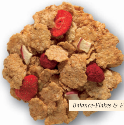
Balance-Flakes & Fruits

>> All'uomo moderno piace scegliere quando si tratta di decidere la colazione. Perché si tratta di un pasto molto importante per essere concentrato ed efficiente sul lavoro o a scuola. Dal müsli alla frutta ai cornflakes e rice-crumpies, nel nostro vasto assortimento di müsli e cereali ce n'è per tutti i gusti.